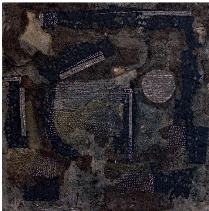
«Horus, il volto del sole»; opera di Loredana Müller Donandini.